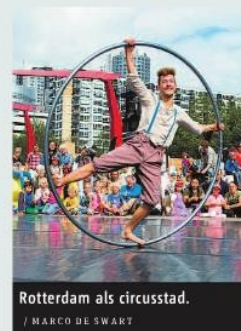
Rotterdam als circusstad.